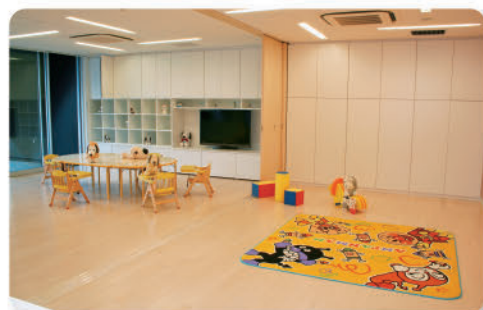
プレイルーム 保育室

月曜日～金曜日 9:00 ~ 17:00 (土曜・日曜・祝日の予約受付は行っておりません。) ご予約は、3営業日前の午後2時までに 電話 096(223)5162 へお申し込みください。 【予約例】月曜日開催の場合：前週水曜日の午後2時までに予約 ※土曜・日曜・祝日の講演会にも対応いたします。